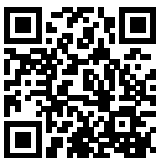
Foto reali Chiudi

Un seducente massaggio TANTRA amp BODY per un intenso piacere. A Prato Italiana https://www.annunci.it/x-364991-z