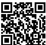
FOTO REALI Chiudi

IL NUOVO MASSAGGIO OLISTICO NATURISTA ITEGRALE