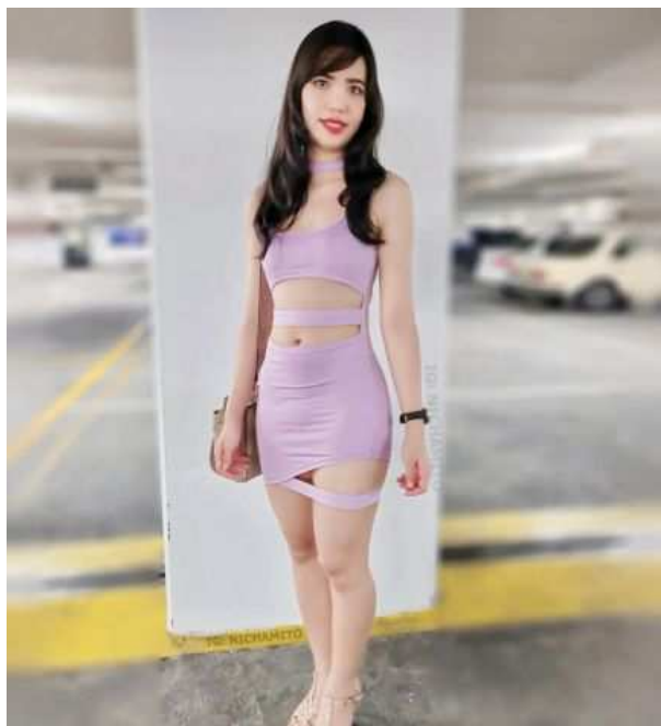
FOTO VERO 100 regalati un momento di relax e coccole BELLISSIME THAI