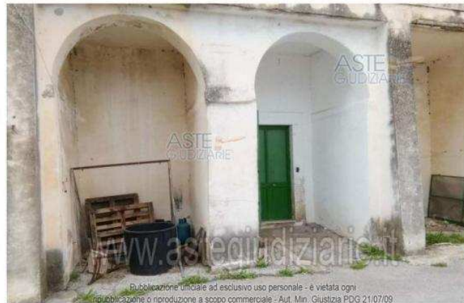
Foto 01. Vista esterna del Subalterno 1

Tribunale di Ragusa Esecuzione Immobiliare N° 101/16 riunita alla N° 291/17 e 382/17