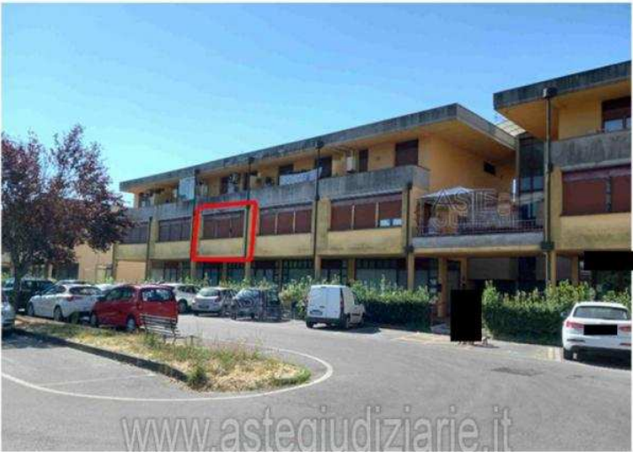
F1 - Vista esterna del compendio immobiliare oggetto di espropriazione bene oggetto di espropriazione approssimativamente delineato con linea rossa

Luogo Toscana, Monsummano Terme https://www.annunci.it/x-377076-z