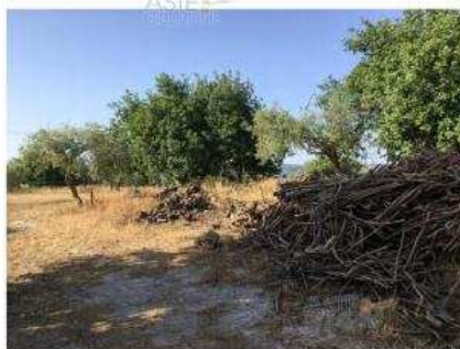
Terreno - Lotto 6