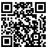
Foto reali Chiudi

A Prato... Vieni, sdraiati, chiudi gli occhi e ti porto in un mondo rilassante