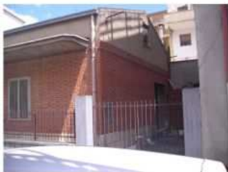
FOTO N.14 ESTERNO RIPRESA DA SUD-OVEST A NORD-EST

D) UNITA' IMMOBILIARE con area pertinenziale sita in Grassano alla Via Bergamo n° 3 - fg. 13 p.la 1445 sub.4