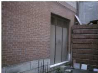
FOTO N.13 ESTERNO RIPRESA DA SUD-EST A NORD-OVEST

Luogo Basilicata, Grassano https://www.annunci.it/x-38979-z