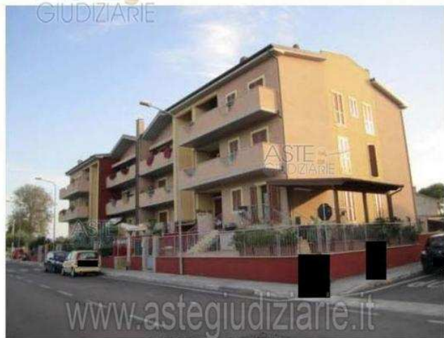
FOTON 24 CESPITE 3 Publicazione unificata ad esclusivo uso personale - è vietata ogni ripubblicazione o riproduzione a scopo commerciale - Aut. Min. Giustizia PDG 21/07/09

Luogo Marche, Chiaravalle https://www.annunci.it/x-398408-z