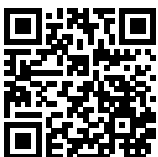
FOTO REALI. NO WHATSAPP. Chiudi