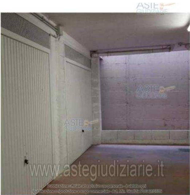
Box n. 9

Luogo Lazio, Fonte Nuova https://www.annunci.it/x-410469-z