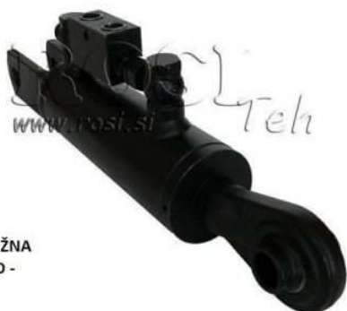
HIDRAVLICNA DVIŽNA POTEZNICA - FORD - NEW HOLLAND

Luogo Friuli-Venezia Giulia, Trieste https://www.annunci.it/x-417925-z