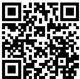
FOTO REALI. NO WHATSAPP Chiudi

LOASI DEL MASSAGGIO NEL KUNDALINI E NEL BODY