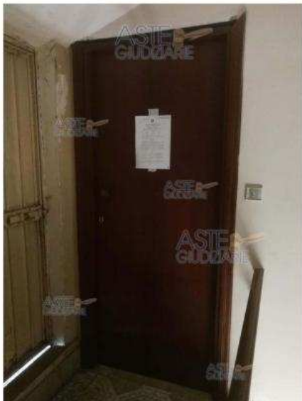
Foto n. 21 immobile sito in San Martino in Pensilis (CB) foglio 23 particella 343 sub 54/55/56/57/58: Via Tremiti 1

Pubblicazione ufficiale del Tribunale di Palermo - 4 ottobre 2023