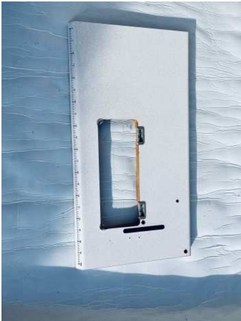
Tavola macchina da cucire industriale (50 EUR)