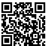
FOTO DA VICINO AUTOGRAFATA ORIGINALE DAL CALCIATORE ITALIANO ROBERTO BAGGIO DELL https://www.annunci.it/x-429874-z