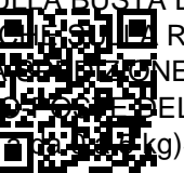
FOTO DA VICINO AUTOGRAFATA ORIGINALE DAL CALCIATORE ITALIANO ROBERTO BAGGIO DELL https://www.annunci.it/x-429874-z