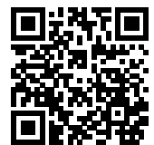
FOTO DA VICINO AUTOGRAFATA ORIGINALE DAL CALCIATORE ITALIANO ROBERTO BAGGIO DELL https://www.annunci.it/x-429874-z