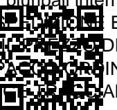
FOTO DA VICINO AUTOGRAFATA ORIGINALE DAL CALCIATORE ITALIANO ROBERTO BAGGIO DELL https://www.annunci.it/x-429874-z