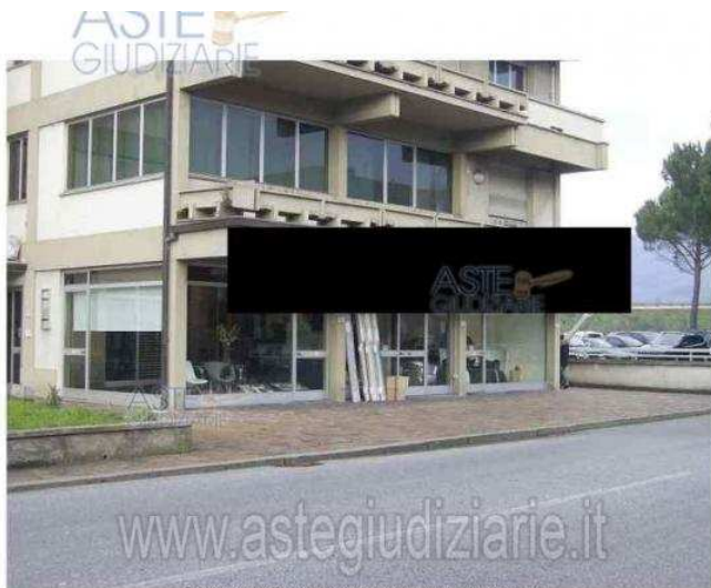
Publicazione ufficiale ad esclusivo uso personale - è vietata ogni ripubblicazione o riproduzione a scopo commerciale - Aut. Min. Giustizia PDG 21/07/09 Foto 01 - Prospetto lato est ( Via Petrocchi) - Palazzina Lotto A -

Luogo Toscana, Monsummano Terme https://www.annunci.it/x-454776-z