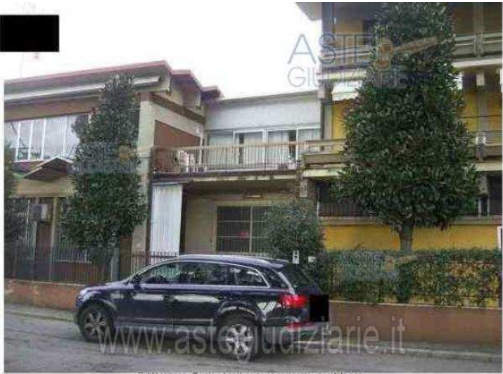
Foto 08 – Veduta porzione prospetto principale lato sud via Berni – Opificio Lotto C–

Luogo Toscana, Monsummano Terme https://www.annunci.it/x-454777-z