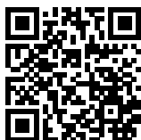
Foto reali Chiudi

I touch you..... you touch me.... Italiana... A Prato...