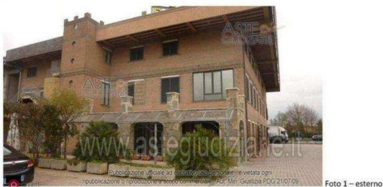
Foto 1 - esterno

Luogo Toscana, Bientina https://www.annunci.it/x-457628-z