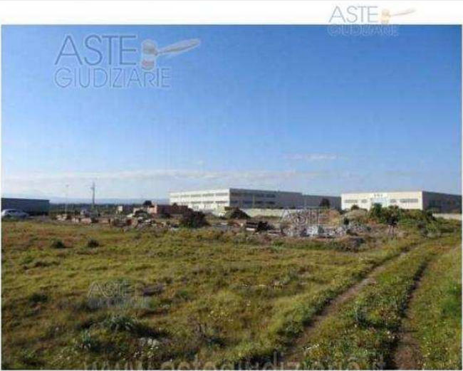
Fotografia 101 - Veduta da strada del confine EST ripubblicazione o riproduzione a scopo commerciale - Aut. Min. Giustizia PDG 21/07/09

Luogo Sardegna, Norbello https://www.annunci.it/x-463186-z