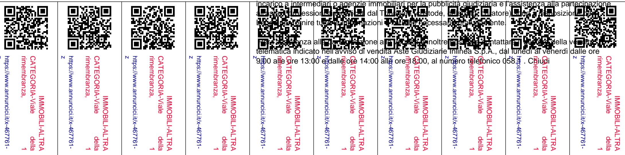
IMMOBILI N.33.34: STE. DI LANC. SUB.12 (N.22) (EX SUB.77) (BOX-GARAGES P.S2)

Questo è l'unico annuncio autorizzato dal Tribunale su questo portale. Il Tribunale non ha conferito alcun incarico a intermediari o agenzie immobiliari per la pubblicità giudiziaria e l'assistenza alla partecipazione all'asta. Per informazioni rivolgersi al Tribunale di Lanciano, Ufficio del Custode, al numero telefonico 0872 611111 o al numero fax 0872 611112. Per informazioni rivolgersi al Tribunale di Lanciano, Ufficio del Custode, al numero telefonico 0872 611111 o al numero fax 0872 611112. Per informazioni rivolgersi al Tribunale di Lanciano, Ufficio del Custode, al numero telefonico 0872 611111 o al numero fax 0872 611112. Per informazioni rivolgersi al Tribunale di Lanciano, Ufficio del Custode, al numero telefonico 0872 611111 o al numero fax 0872 611112.