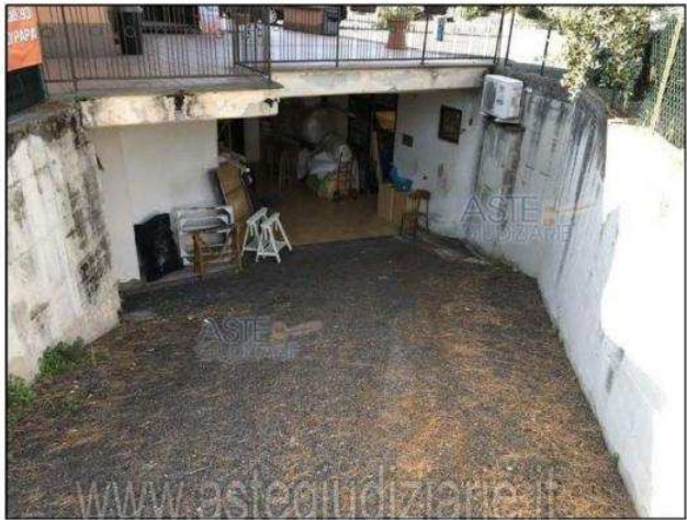
FOTO 1 - INGRESSO AL CORRIDOIO CENTRALE DEL P. S1

Luogo Lazio, Rocca di Papa https://www.annunci.it/x-475403-z