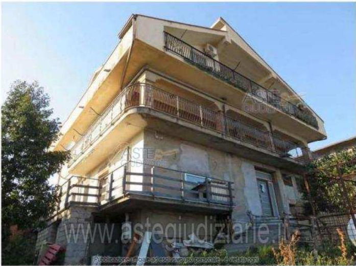
Illustrazione 12: Prospetto sud-est

Luogo Sicilia, Scordia https://www.annunci.it/x-475407-z