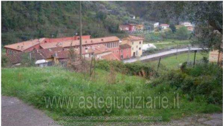
FOTO 05 - VEDUTA PORZIONE MAPPALE 710

all'asta. I professionisti incaricati dal Tribunale (custode, delegato, curatore) sono a disposizione per fornire tutte le informazioni necessarie all'acquirente. Per l'assistenza alla partecipazione all'asta, oltre al sito web, è possibile contattare il delegato alla vendita indicato nel presente annuncio, dal lunedì al venerdì dalle ore 9:00 alle ore 13:00 e dalle ore 14:00 alle ore 18:00, al numero telefonico 0581. Chiudi