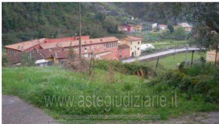
FOTO 05 - VEDUTA PORZIONE MAPPALE 710

Luogo Toscana, Pescia https://www.annunci.it/x-479349-z