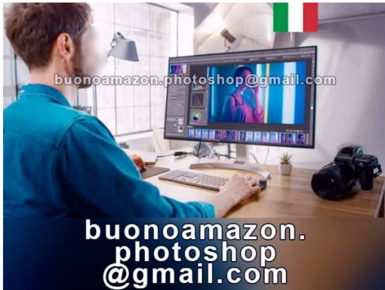
Grafico Photoshop Fotoritoccatore Professionale

Luogo Toscana, Firenze https://www.annunci.it/x-489795-z