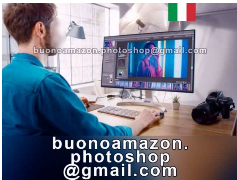
Grafico Photoshop Fotoritoccatore Professionale

Luogo Calabria, Catanzaro https://www.annunci.it/x-489796-z