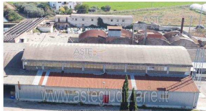
Publicazione ufficiale ad esclusivo uso personale. È vietata ogni ripubblicazione o riproduzione a scopo commerciale - Aut. Min. Giustizia PDG 21/07/09 Foto 3: Vista prospetto fabbricato

IMMOBILI-IMMOBILE COMMERCIALE-Via migliara 45 https://www.annunci.it/x-497771-z