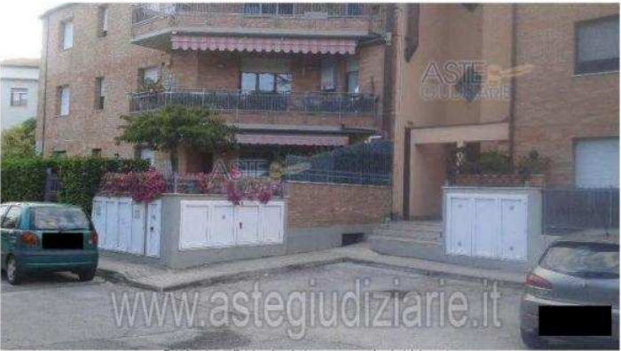
Publicazione ufficiale ad esclusivo uso personale - è vietata ogni ripubblicazione o riproduzione a scopo commerciale - Aut. Min. Giustizia PDG 21/07/09