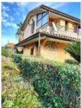
FOTO 2 - PROSPETTO FRONTALE E LATERALE SINISTRO www.astegudiziarie.it Pubblicazione ufficiale del notaio o del professionista - a richiesta ogni qualificazione e riproduzione a scopo commerciale - art. 180, Codice P.D. 21/07/01

Prospetto frontale e laterale sinistro del bene in vendita - Via Berna n. 2 - Località Quotrio San Girolamo