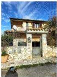
FOTO 1 - INGRESSO SU VIA BERNA