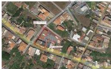
FD L.3-1: veduta aerea immobile ubicato in Acireale (CT), via Patrica n. 2;