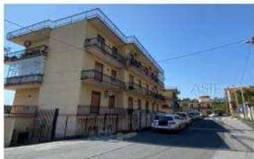
FD L.3-2: veduta Via Patrica: sala ex l'edificio civ. 2;