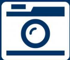
IMMAGINE NON DISPONIBILE

Luogo Sardegna, Monastir https://www.annunci.it/x-516753-z