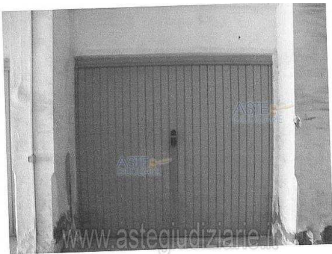
Foto n.28 - Unità immobiliare n.11 - box auto Publicazione ufficiale ad esclusivo personale - è vietata ogni riproduzione o diffusione a scopo commerciale - Aut. Min. Giustizia PDG 21/07/09

Luogo Sicilia, Caltagirone https://www.annunci.it/x-517838-z