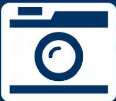
IMMAGINE NON DISPONIBILE

Questo è l'unico annuncio autorizzato dal Tribunale su questo portale. Il Tribunale non ha conferito alcun incarico a intermediari o agenzie immobiliari per la pubblicità giudiziaria e l'assistenza alla partecipazione all'asta. I professionisti incaricati dal Tribunale (custode, delegato, curatore) sono a disposizione per Legge per fornire tutte le informazioni e l'ausilio necessario gratuitamente.