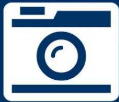
IMMAGINE NON DISPONIBILE