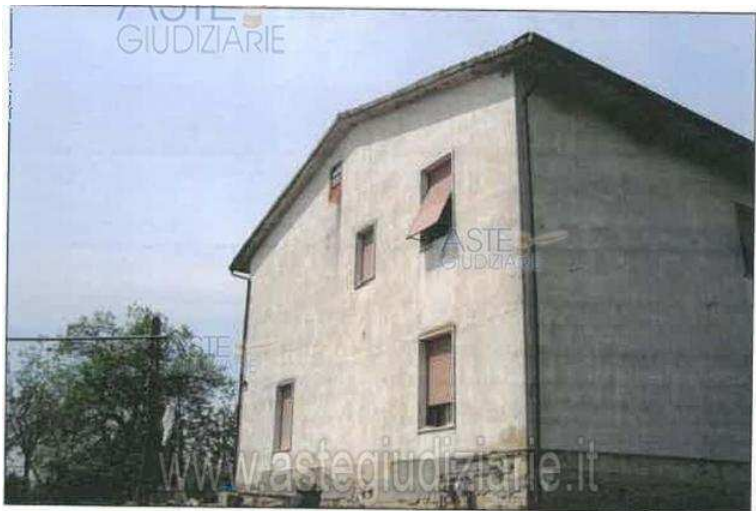
Ripresa n. 9 – Prospetto laterale est del fabbricato costituito dai Beni 11-12-13-14

Luogo Toscana, Lamporecchio https://www.annunci.it/x-526688-z