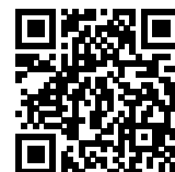
FOTO 100 REALI CORPO SU CORPO DA SOGNO