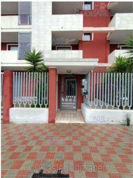
Fotografia: 7° Ingegnere generale into via Gen. C.A. Dalla Chiesa

Luogo Sardegna, Quartu Sant'Elena https://www.annunci.it/x-549076-z