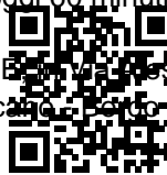
FOTO REALI AL 100, VIENI A SCOPRIR...CI PROMO MARZO... CHIAMA ORA.....