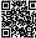
FOTO REALI AL 100, VIENI A SCOPRIR...CI PROMO MARZO... CHIAMA ORA.....