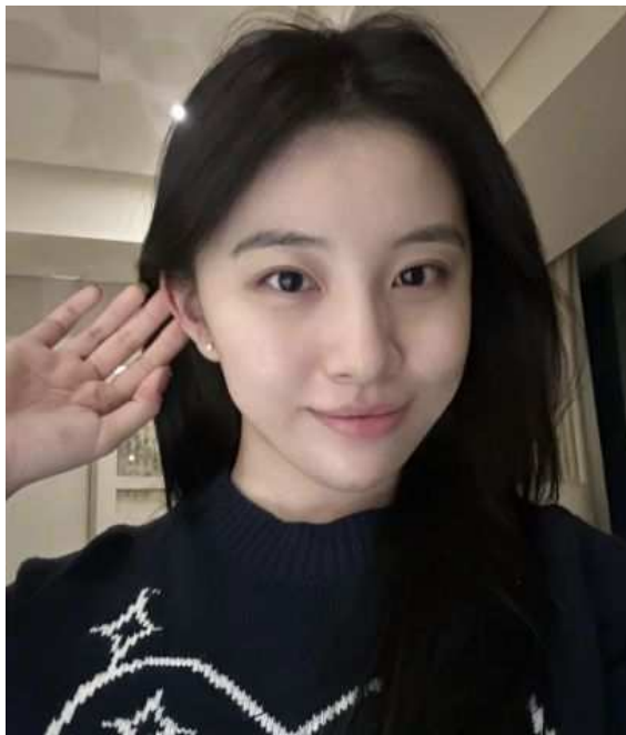
foto sono vero 3510826431Vuoi provare un'esperienza via santi venceslao 18 41

Luogo Emilia-Romagna, Modena https://www.annunci.it/x-558797-z