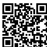
foto sono vero 3510826431Vuoi provare un'esperienza via santi venceslao 18 41 https://www.annunci.it/x-558797-z