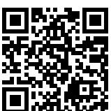
foto sono vero 3510826431Vuoi provare un'esperienza via santi venceslao 18 41 https://www.annunci.it/x-558797-z