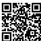
foto sono vero 3510826431Vuoi provare un'esperienza via santi venceslao 18 41 https://www.annunci.it/x-558797-z