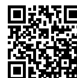
foto sono vero 3510826431Vuoi provare un'esperienza via santi venceslao 18 41 https://www.annunci.it/x-558797-z