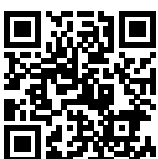
foto sono vero 3510826431Vuoi provare un'esperienza via santi venceslao 18 41 https://www.annunci.it/x-558797-z