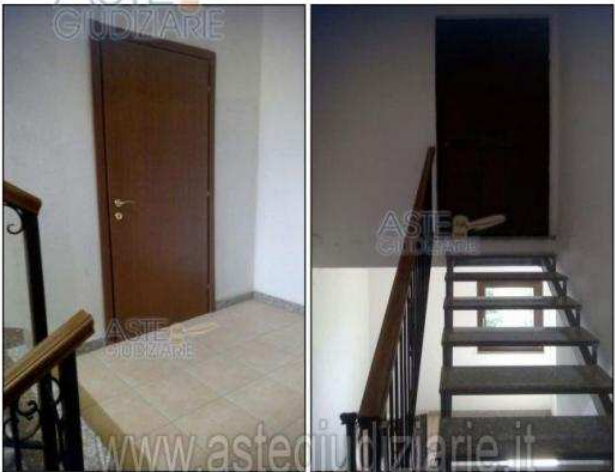
Fg.43 – Part. 2029 – Sub 68, 70, 71, 72, 73, 75, 76, 83 (simili fra loro)

Publicazione ufficiale ad esclusivo uso personale - è vietata ogni ripubblicazione o riproduzione a scopo commerciale - Aut. Min. Giustizia PDG 21/07/09