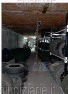
Foto 6. Vista dal fondo del locale verso la serranda d'accesso.

Pubblicazione ufficiale ad esclusivo uso personale 1 - è vietata ogni ripubblicazione o riproduzione a scopo commerciale - Aut. Min. Giustizia PDG 21/07/09