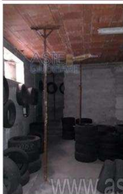
Foto 5 – Vista interna, sul fondo l'accesso alla scala da tombare.

Per maggiori informazioni alla presente vendita, e per conoscere inoltre i modi di contattare l'Ufficio della vendita telematica indicato nell'avviso di vendita Aste Giudiziarie In linea S.p.A., dal lunedì al venerdì dalle ore 9:30 alle ore 13:00 e dalle ore 14:00 alle ore 18:00, al numero telefonico 0581. . Chiudi