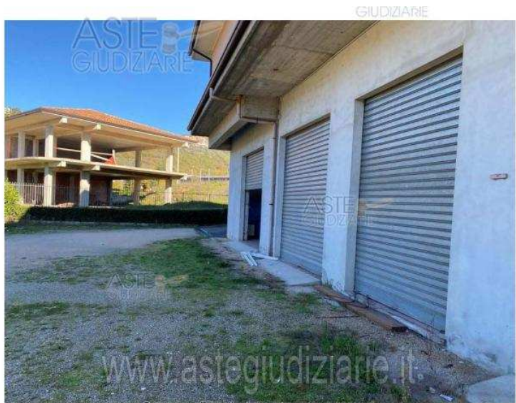
Foto n. 2 – Pubblicazione ufficiale ad esclusivo uso personale - è vietata ogni ristampa o riproduzione senza permesso scritto dalla Aste Giudiziarie Inlinea S.p.A.

Per l'assistenza alla partecipazione alla vendita è possibile contattare il soggetto specializzato Aste Giudiziarie Inlinea S.p.A., dal lunedì al venerdì dalle ore 9:00 alle ore 13:00 e dalle ore 14:00 alle ore 18:00, al numero telefonico 058 1 . Chiudi