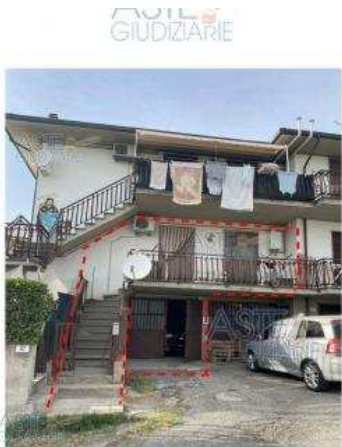
Vista del prospetto che si affaccia su via Toiano L'appartamento si trova al piano rialzato lato sinistro, il cancelletto aperto consente l'accesso alle scale ad uso esclusivo

www.astegiudiziarie.it Pubblicazione ufficiale ad esclusivo uso personale - è vietata ogni ripubblicazione o riproduzione a scopo commerciale - Aut. Min. Giustizia PDG 250709