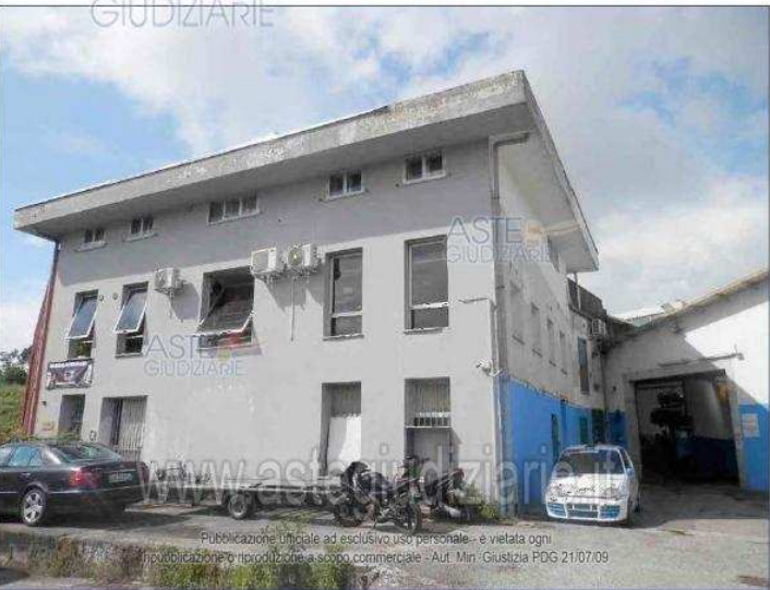
Publicazione ufficiale ad esclusivo uso personale - è vietata ogni riproduzione o riproduzione a scopo commerciale - Aut. Min. Giustizia PDG 21/07/09