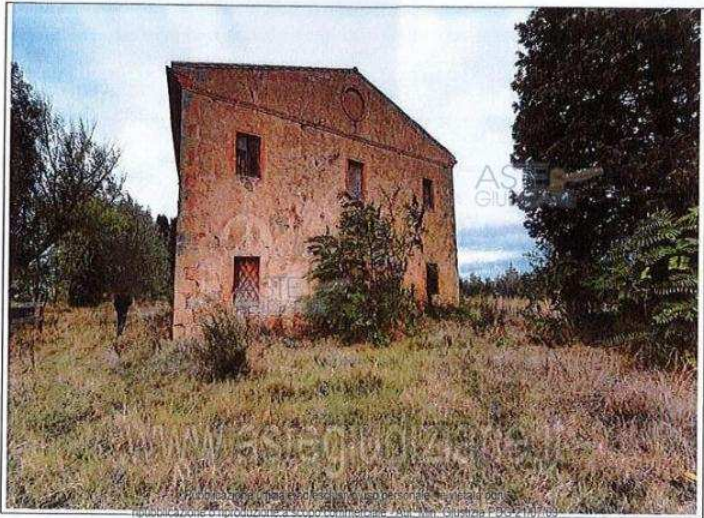
VEDUTE EDIFICIO RURALE

all'asta. I professionisti incaricati dal Tribunale (custode, delegato, curatore) sono a disposizione per fornire tutte le informazioni necessarie all'acquirente. Per la partecipazione all'asta, oltre a contattare il custode della vendita, è necessario indicare la propria offerta di acquisto, dal lunedì al venerdì dalle ore 9:00 alle ore 13:00 e dalle ore 14:00 alle ore 18:00, al numero telefonico 0587 1. Chiudi