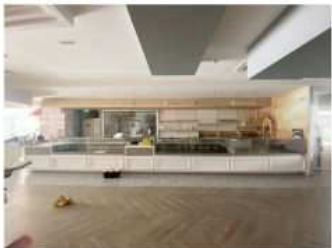
Foto n. 8: Linea banco vendita alimentari (Vice n. 4 dell'inventario)

Luogo Campania, Baronissi https://www.annunci.it/x-586507-z