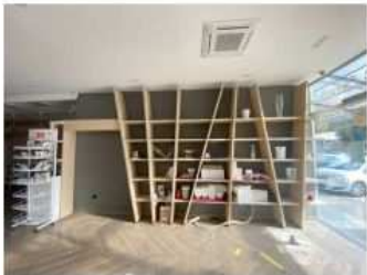
Foto n. 7: scaffale espositivo in legno con portale (Vice n. 3 dell'inventario)