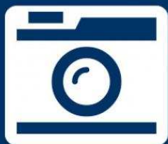
IMMAGINE NON DISPONIBILE