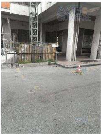
POSTO AUTO CI