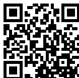
FOTO 100 VERE 3510826431Vuoi provare un'esperienza via santi venceslao 18 41123 https://www.annunci.it/x-599307-z