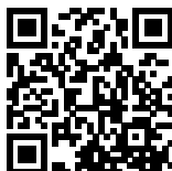
FOTO 100 VERE 3510826431Vuoi provare un'esperienza via santi venceslao 18 41123 https://www.annunci.it/x-599307-z